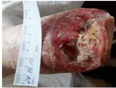
Abb. 14: 24.03.2019 Verbandswechsel unverändert, Knochen sichtbar.