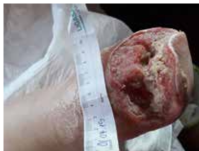
Abb. 17: 01.04.2019 Die Wunde hat sich deutlich verkleinert, die Fibrinbeläge sind deutlich reduziert.