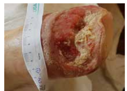
Abb. 21: Wundzustand am 11.04.2019