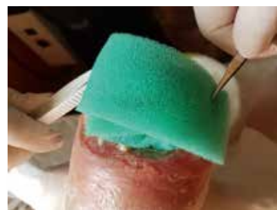
Abb. 9: 18.03.2019 Wundabdeckung mit sterilem LIGASANO® grün der Größe 15 x 5 x 0,6 cm.