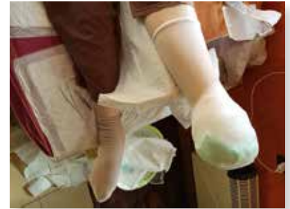
Abb. 12: 18.03.2019 Abdeckung mit einer Zetuvit plus Saugkomresse der Größe 10 x 20 cm und abschließende Fixierung mit LIGAMED®. Vorteil: Keine Druckstellen und keine Einschnürung.