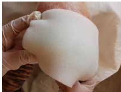
Abb. 26: 11.04.2019 Verbandsaufbau