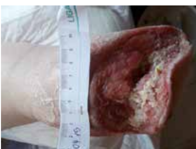
Abb. 19: 01.04.2019 Wundfüller und Primärverband nun ausschließlich LIGASANO® weiß, um das neu gebildete Granulationsgewebe nicht zu zerstören.