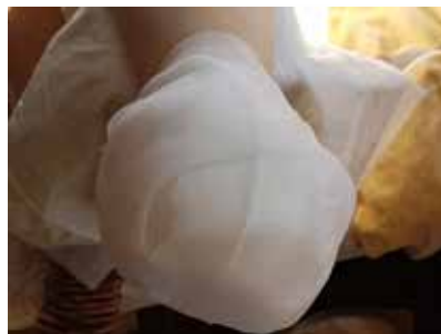
Abb. 29: 11.04.2019 Verbandsaufbau