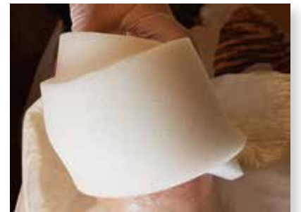
Abb. 27: 11.04.2019 Verbandsaufbau