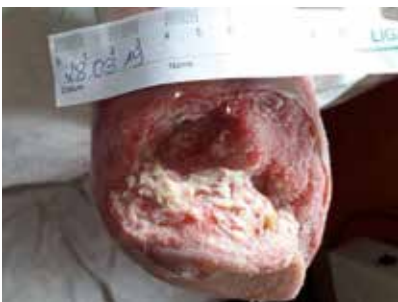
Abb. 16: 28.03.2019 Verbandswechsel unverändert. Krankenhauseinweisung aufgrund eines Apoplex.