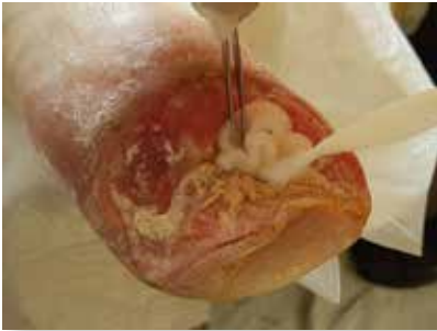
Abb. 22: 11.04.2019 Verbandsaufbau