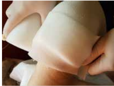
Abb. 11: 18.03.2019 Der Verbandsaufbau wurde mit einer unsterilen LIGASANO® Binde (Größe 300 x 10 x 0,3 cm) fixiert. Die Binde fördert zusätzlich die Durchblutung der umgebenden Haut und nimmt Hautschuppen ab.