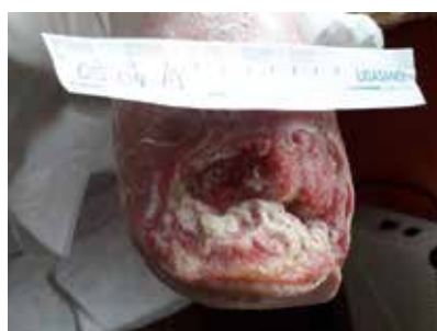
Abb. 20: 05.04.2019 Zunahme der Fibrinbeläge im unteren Teil, daraufhin im Bereich der Beläge wieder LIGASANO® grün Wundband mini eingelegt.