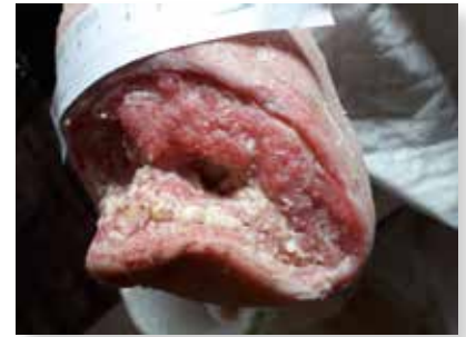
Abb. 15: 28.03.2019 Verbandswechsel unverändert.