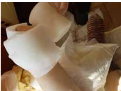
Abb. 28: 11.04.2019 Verbandsaufbau