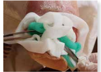
Abb. 24: 11.04.2019 Verbandsaufbau