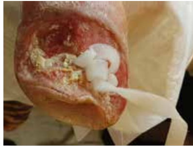
Abb. 23: 11.04.2019 Verbandsaufbau